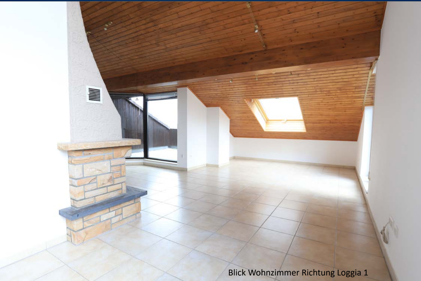
Blick Wohnzimmer Richtung Loggia 1