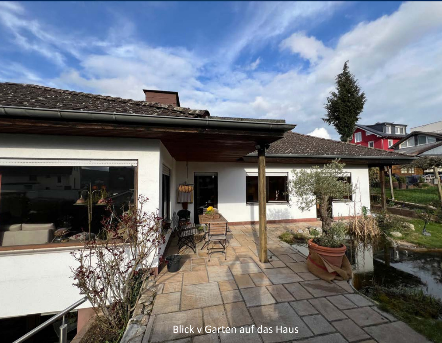
Blick v Garten auf das Haus