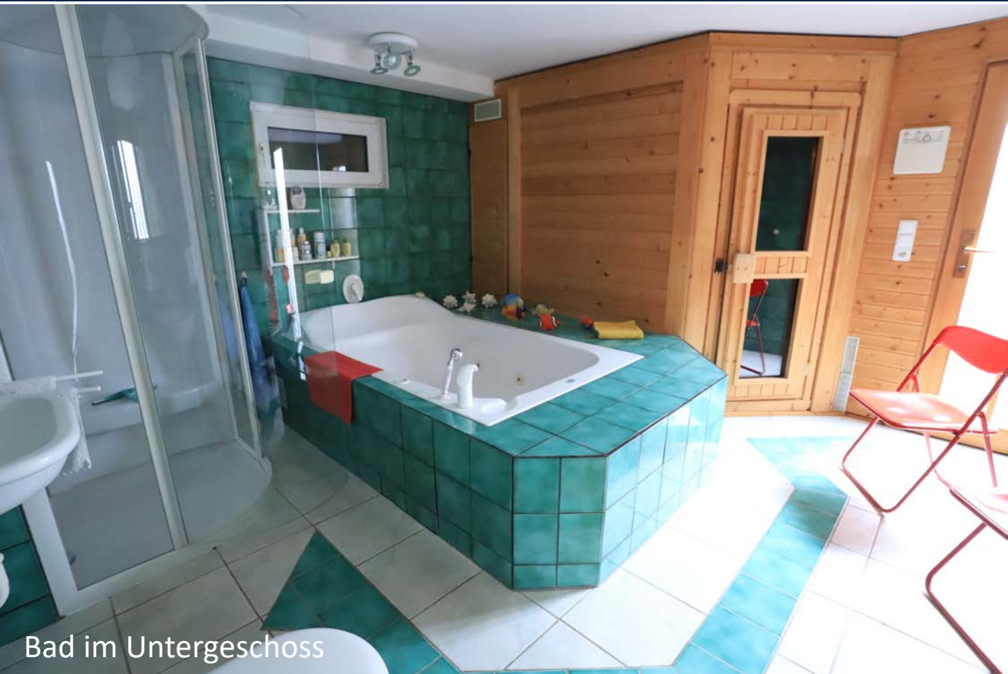
Bad im Untergeschoss